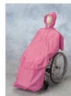
車いす用レインウェア