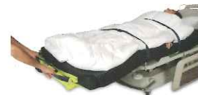
レスキューシート

万一の非常時に役立つ防災グッズを展示します。ベッドに寝ている方をマットレスごと避難させることができるレスキューシートなど、必見です。どうぞ3階の福祉用具展示場にお越しください。