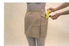
大腿骨を守ってくれる パッド付スカート

転んだ衝撃から大腿骨を守ってくれるスカートや、捻挫防止のために足首を固定するサポーターなどの転倒予防グッズを紹介します。