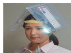
A4 ファイル型のヘルメット

11月のテーマは「備えて安心!防災グッズ」です。持ち運びできるA4ファイル型のヘルメットや、非常時に便利な圧縮毛布など、災害時に役立つ様々なグッズをご紹介します。どうぞ3階の福祉用具展示場にお越しください。