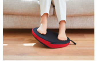
座ったままで足の運動 (前後や左右にゆらゆら動かします)