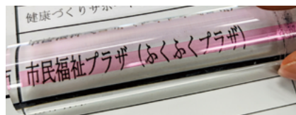
文字を拡大し、ラインにより読み取りやすくなる 「カラーバールーペ」