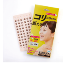
貼るだけで、簡単にセルフケア (独自のくさび型突起がコリをやわらげます)

バランスボールのようなクッションや、仙骨を自然と立ち上げ姿勢を楽に正すクッション、椅子に引っ掛けて背中をマッサージするアイテムなど、日常のストレス解消や健康維持に役立つグッズを多数紹介します。