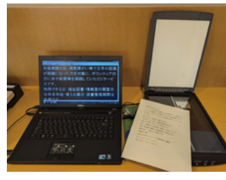
スキャナーで読み込んだ資料を 読み上げる「音声読み上げ機」