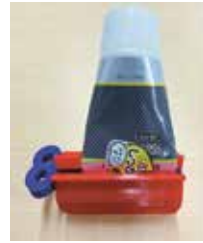
片手でできるしぼり器