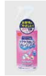
トイレットペーパーを“流せるおしりふき”に変えるスプレー

5・6月のテーマは「保清・口腔ケア」です。 片手でも回しやすいようにグリップが大きめに作られたしぼり器や、経済的負担・肌への負担も少なくする！トイレットペーパーを“流せるおしりふき”に変えるスプレーなどを紹介します。