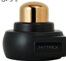
管理医療機器 温灸器

装具ごとまるごと防寒してくれる車いす防寒キルトコート(キッズ用)や、温熱で筋肉の奥深くまで刺激してくれる温灸器などを紹介します。