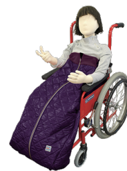
車いす防寒キルトコート (キッズ用)